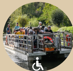
Clairmarais Bateau promenade