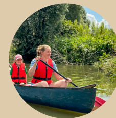
Canoë De 1 à 3 pers.