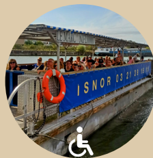
Le Marc Bateau couvert