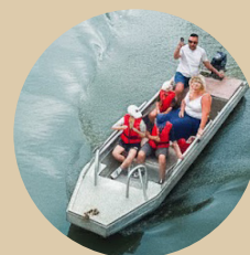
Barque à moteur De 1 à 6 pers.