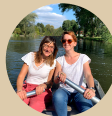
Barque à rames De 1 à 6 pers.